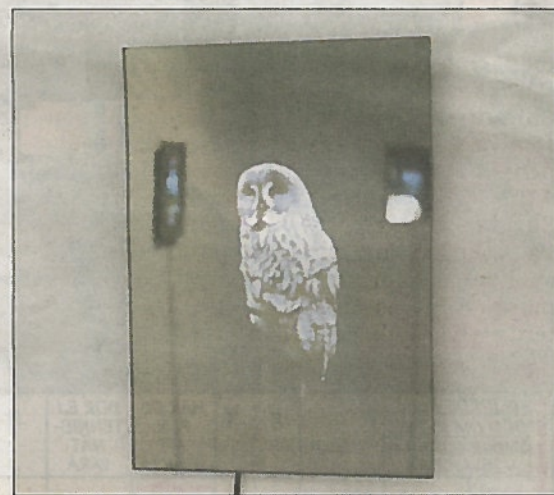
Fotografierna är även speglar som reflekterar betraktaren.