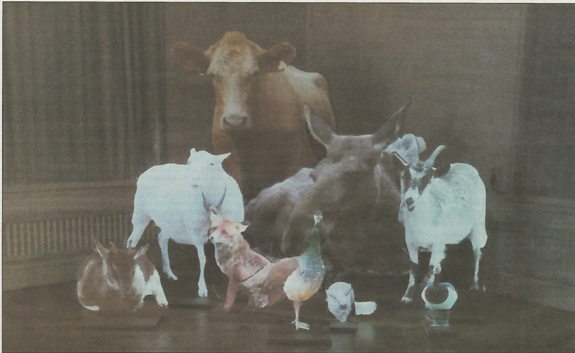
På utställningen visas motiv som vid en första anblick ser ut att vara fotografier, men små rörelser avslöjar att det är rörliga bilder, skriver Johan Fingal.